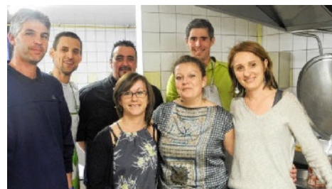
Ils ont toujours la frite à l'amicale laïque !

Les élections départementales remplacent désormais les élections cantonales. Elles désignent les membres du conseil départemental (ex-conseil général) dans le cadre de cantons qui ont eux même été redécoupés.