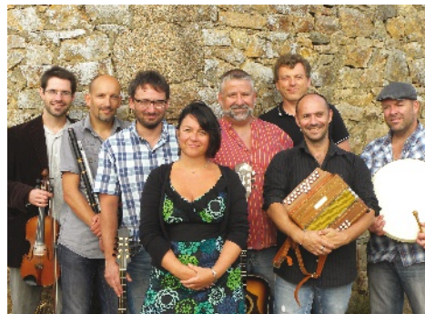
Pour la St Patrick, le groupe Cabhán sera en concert à domicile